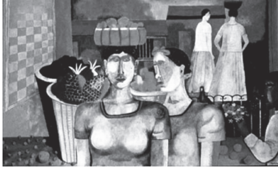
Görsel 2: Rufino Tamayo, Tehuantepec Kadını, 1939, Yağlı Boya

yenilikçi bakış açısını da unutmamak gerekmektedir. Fakat onlardan da önce Rufino Tamayo (1899-1991) ve Carlos Mérida (1891-1984) gibi ressamlardan bahsetmek gerekmektedir. Çünkü bu sanatçılar ortaya çıkardıkları eserlerle sanatta eskinin bittiğinin ve yeninin başladığının habercisiydiler. İki sanatçı da Meksika Duvar Resimciliği (20'ler ve 40'lar arası) sanat akımının faaliyet gösterdiği dönemlerde aktiftiler. Fakat bu sanatçılar, bu akımın izlediği yolun değil de kendi oluşturdukları yolun takipçisiydiler.