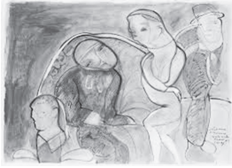
Görsel 3: José Luis Cuevas, La Residencia de Estudiantes, 1997, çizim

bahsetmemiz gerekmektedir. Cuevas yaşadığı neslin sanatçıları arasında baş kaldıracı karakteriyle öne çıkmıştır. Sanat eğitimi resim ve heykel okulu olan Esmeralda'da alan sanatçı aynı zamanda "La Ruptura" hareketinin öncüsü olarak o dönem içinde yerini almıştır. Tamayo'nun sanatta izlediği yenilikçi yolu kendine örnek almış, bu şekilde diğer meslektaşlarından farklı olarak dış dünyayı deforme eden daha dışavurumcu bir çizgiyi dil olarak seçmiştir sanatında. Devletin dayattığı normların sanatçının kendini özgürce ifade edebilmesine kısıtlama getirdiğini düşünerek gerçek dünyayı reddetmiş ve ona kendi gözünden başka bir yorum getirmiştir. Bu öyle bir reddediştir ki, tuvallerinde veya heykellerindeki insan figürleri bazen canavarlaştırılmış metamorfozlar olarak karşımıza çıkmaktadır.