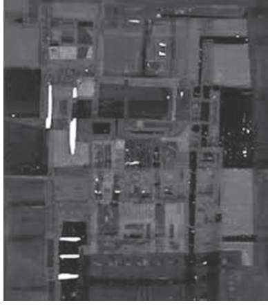
Görsel 5: Vicente Rojo, Laberinto A, 1960, Kağıt Üzerine Guaj

yol olarak seçmiştir. Sanatçı Cuevas'tan farklı olarak figürden uzak durmuş ve iç dünyasında kopan fırtınaları bilinçaltının onu yönlendirdiği şekilde lekeci bir yaklaşımla dile getirmiştir. Bu doğrultuda Carrillo'nun sanatını icra ederken izlediği belli bir metod yoktur aksine sanatçı tuvallerinde başı ve sonu belli olmayan, plansız bir yol izlemiştir; öyle ki resim renklerle ve fırça darbeleriyle kendi kendine anlam kazanır.