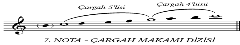
Şekil 9: 7. Nota- Çargah Makamı Dizisi (Özkan, 2000: 95).

Balıkçıların üzerlerine Kutsal Ruh'u gönderip onları çok hikmetli kulan ilahımız Mesih. Sen mübareksin. Onlarla bütün dünyayı avladın, Ey insanları seven, sana yücelik olsun (Altınağızlı Aziz Yuhanna Tören Kitabı, 2007).