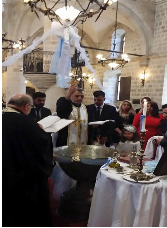
Şekil 5:Antakya Ortodoks Kilisesinde Yapılan Vaftiz Ayini Görüntüsü