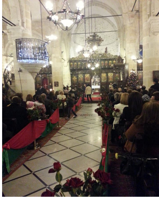
Şekil 4: Antakya Ortodoks Kilisesinde Yapılan Noel Ayini Görüntüsü (Karaburun Doğan, 2015:246) .

Antakya'da, 23 Aralık günü Noel'i anlatan bir Oratoryo oynanır, çocuklara hediye dağıtılır. Noel Baba hediye dağıtırken, Antakya'da yaşayan diğer cemaatlerin çocukları da burada bulunur ve onlar da bu hediyelerden alabilirler. Noel 25 Aralık'ta kutlanır ve bugün değişmez. Bu bayramlarda kilisede toplu Noel ayini yapılır, koroyla birlikte bu özel günü anlatan ilahiler seslendirilir ve mum yakılarak dua edilir. Törenin ardından kilisenin bahçesine çıkan vatandaşlar birbirlerinin bayramını kutlar.