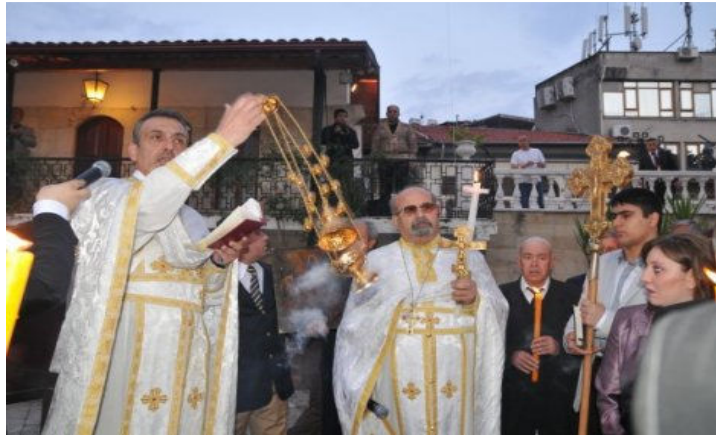
Şekil 3: Antakya Arap Ortodoks Kilisesi Bahçesinde Yapılan Paskalya Bayramı Kutlamaları

Paskalya Bayramı 5 Nisan- 6 Mayıs arasındaki bir Pazar günü kutlanır. Bu tarih aynı zamanda 6 Mayıs Hıdrellez (baharın gelişi) kutlamalarına denk gelmektedir. Hıristiyanlar Paskalya Bayramını önce kilisede düzenlenen ayine katılıp, daha sonra yumurta tokuşturarak kutlarlar. Antakya Ortodoks Kilisesi'nde sabah saat 05.00 'de Ortodokslar önce kilise içerisinde daha sonra kilise avlusunda yaktıkları mumlarla Mesih İsa'nın doğuşunu ve göğe çıkışını kutlarlar (Karaburun Doğan, 2015: 111-112).