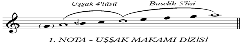
Şekil 6: 1. Nota- Uşşak Makamı Dizisi (Özkan, 2000: 120).

“Ürdün nehrindeki vaftizin ile ya rab, kutsal üçlemeye secde zuhur etti, Zira Baba'nın sesi, seni sevgili oğul diye isimlendirerek şahadet etmiştir. Ve ruh bir güvercin görünümünde kelamın gerçekliğini teyit ediyor. Sen ki zuhur ettin ve insanları aydınlattın ey Mesih ilahımız, sana yücelik olsun” (Altınağzlı Aziz Yuhanna Tören Kitabı, 2007)