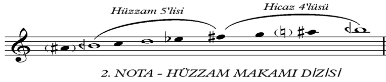
Şekil 7: 2. Nota- Hüzzam Makamı Dizisi (Özkan, 2000: 288).

Ođlu bizleri kurtar, senki bakireden dođdun, sana ilahiler ile ALİLUIYA” (Altınađızlı Aziz Yuhanna Tören Kitabı, 2007).