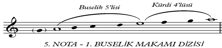
Şekil 8: 5. Nota- Buselik Makamı Dizisi (Özkan, 2000: 98).

“ Mesih ölümler arasından dirildi, ölümü ölümle ezdi ve Mezarlarda bulunanlara hayat verdi ” (Altınađızlı Aziz Yuhanna Tören Kitabı, 2007)