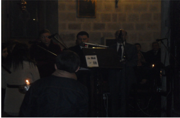
Şekil 2: Antakya Ortodoks Kilisesi Psaltileri (Karaburun Doğan, 2015: 245)

Ancak İslami dinsel müzik performansından farklı olarak Ortodoks ilahilerinde ‘dem tutma’ olgusu vardır ki bu olgu, bir anlamda ostinato görevi gören ilkel birçok seslilik dir. Dimitri Doğum, bu dem tutma olgusunu betimlerken; “Antakya’da yaşayan Arap Ortodokslarda dem eşliğinde söylenen ilahilerde, karar sesinin 3. veya 5. derecelerinden okunan alt ezgiye tabaka ses denir. Bu tabaka sesi, 2 ya da 3 kişi tarafından tutulur ve o ses üzerine diğer koro üyeleri ilahilerini seslendirir” 17 (Doğum, 2012/Antakya) ifadesini kullanmıştır.