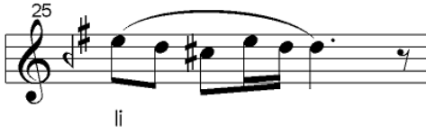
Şekil 3: Neva Kâr'da neva ve hicaz perdeleri arasındaki ilişki

Neva perdesi üzerinde yoğunlaştıktan sonra, segah perdesini kullanarak çargah perdesinde durak yapan benzer bir aktarım Neva Beste'de de işaret edilmiştir: