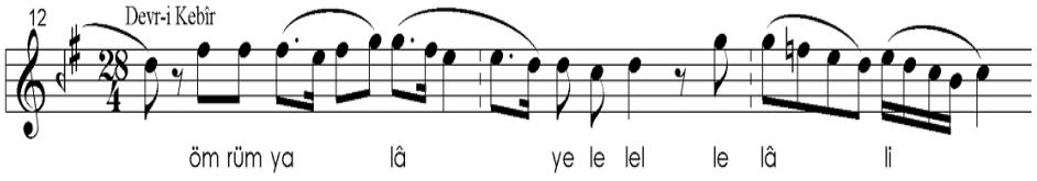
Şekil 4: Neva Beste'deki eviç-acem değişimi

Neva perdesi üzerinde yoğunlaştıktan sonra, segah perdesini kullanarak çargah perdesinde durak yapan benzer bir aktarım Neva Beste'de de işaret edilmiştir: