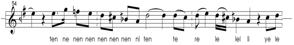
Şekil 6: Neva Kâr'da Hicaz geçkisi

Mahur Beste'nin meyan kısmında ise benzer bir hicaz geçkisinin muhayyer perdesi üzerinde gerçekleştiği göze çarpmaktadır (Şekil 7):