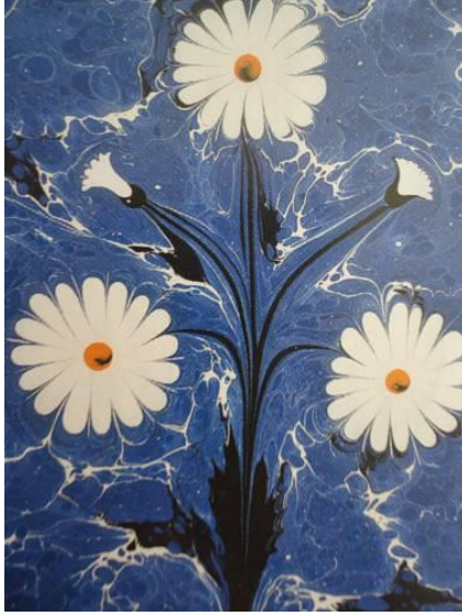
Resim 5: Fuat Başar, “ Çiçekli (Papatya) Ebru ”.

Hıra gibi sanatçılar yetiştirdiği öğrencilerden bazılarıdır (Üstün, 1997: 365). Fuat Başar aynı zamanda Hamit Aytaç'ın öğrencisi olmuş ünlü bir hattattır.