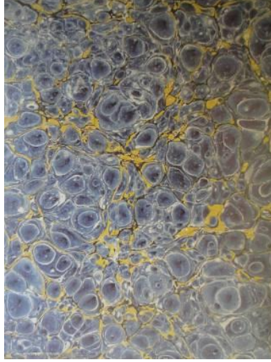
Resim 2: Şeyh Sadık Efendi, “Neftli Battal Ebru”.

pür marifet, meşhur adlarıyla bilinen Edhem Efendi, ebrunun hemen hemen yeniden başlamasını sağlamıştır. Bilhassa yapılış usulünü ortaya çıkardığı ve sonradan bu sanata büyük katkı sağlayacak Üsküdar’lı Hattat Necmeddin Okyay ve Abdülkadir Efendi gibi öğrencileri yetiştirdiği için Edhem Efendi’nin bu alandaki katkıları çok önemlidir (Biol, 1969: 4).