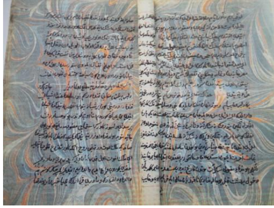
Resim 1: Şebek Mehmet Efendi, “Sayfa Zemini Şal Ebru”.

Tertib-i Risale-i Ebri’de adı geçen ve lakabı Şebek olan ebrucu bugüne kadar tespit edilebilmiş en eski ebrucumuzdur (Yazan, 1986: 42). Aynı zamanda Şebek Mehmed Efendi Tertib-i Risale-i Ebri isimli kitabıyla ebru yapımını belgeleyen kişidir (Uyar, 1992: 30).