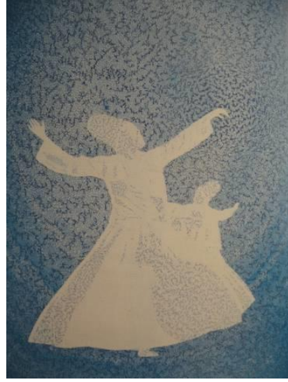
Resim 7: Hikmet Barutçugil, “ Barut Ebru ”.