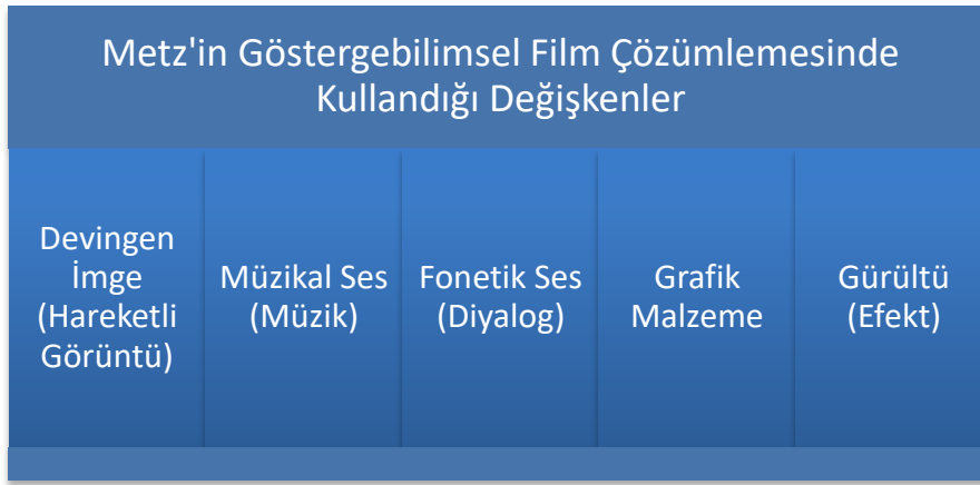
Şekil 2. Metz'in Göstergebilimsel Çözümlemede Kullandığı Değişkenler

Metz ile birlikte göstergebilimin sınırları metinleri aşarak, her tür görsel görüntünün çözümlenmesinde ve anlamlandırılmasında kullanılır hale gelmiştir. Dolayısıyla Andrew'in de belirttiği gibi Metz, göstergebilimi kullanarak sinemada yer alan anlamlama süreçlerinin oluşumunu ve biçimlerini tanımlamayı hedeflemiştir (Andrew, 2000: 243). Bu anlamda Metz'in kaleme aldığı "Sinema: Dil mi, Dil Yetisi mi" adlı makalesi, sinemayla göstergebilim arasındaki ilk ilişkileri sağlama açısından oldukça önemlidir (Casetti, 1999: 132). Metz'in daha sonra göstergebilimle sinemayı derinlemesine bir ilişki içinde ele aldığı " Sinemada Anlam Üstüne Denemeler " adlı kitabında bir filmin göstergebilimsel olarak çözümlenmesinde kullanılacak tözlere değinmiştir. Andrew, bu tözleri, bir filmde yer alan bilgi kanalları olarak değerlendirmiş ve bu bilgi kanallarının da filmin anlamlandırılmasında oldukça büyük öneme sahip olduğunu belirtmiştir (Andrew, 2000: 249). Metz'in ortaya attığı tözler, aynı zamanda bu çalışmada film analizleri sırasında kullanılacak olan değişkenler olması nedeniyle ayrıca bir öneme sahip olduğundan aşağıdaki gibi bir tabloda gösterilmeleri, daha anlaşılır olması açısından önemlidir.