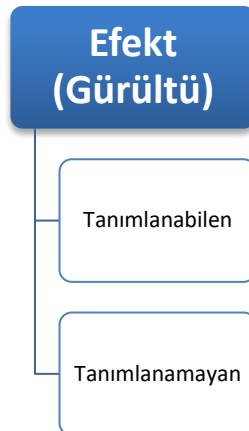
Şekil 3. Metz'in Kullandığı Gürültü Tözünün Türleri

Metz'in göstergebilimsel analiz yönteminde yer alan ve bu çalışmada da film incelemeleri sırasında kullanılacak olan diğer bir töz, gürültü ya da diğer bir adıyla efekt değişkenidir. Efekt de tıpkı diğer sinematografik anlatım araçları kadar anlam oluşturma sürecinde etkili bir unsurdur. Ancak efekt denince akla, genellikle günümüzde büyük ölçüde dijital teknolojinin ürünü olan yüksek maliyetli filmlerdeki görüntüleri destekleyen yüksek ses seviyeleri gelmektedir. Oysa Mahmut Tali Öngören'in de belirttiği gibi ses efekti, konuşmayı ya da görüntüyü desteklemekte, bir yeri tanımlamakta, bir hava ya da atmosfer yaratmakta ve zaman belirtmekte kullanılan önemli bir unsurdur (Öngören, 1991: 121). Efektler, aşağıdaki tabloda da gösterildiği gibi iki gruba ayrılmaktadır: