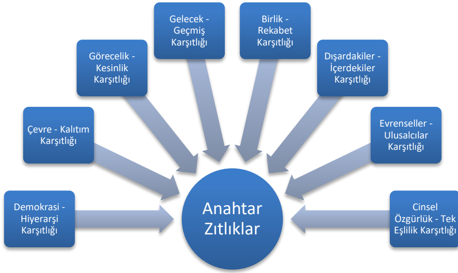
Şekil 1. Filmin Eleştirel ve İdeolojik Konumunu Belirleyen Anahtar Zıtlıklar (Güçhan, 1999: 197)

Araştırmamanın kuramsal dayanak noktalarından birisi de aynı zamanda çalışma kapsamında incelenen filmlerin eleştirel yapılarını ortaya koymaya yönelik olarak Louis Gianetti'nin ortaya koyduğu "anahtar karşıtlıklar" kategorisidir. Gianetti, bu kategoride belirttiği karşıtlıklar üzerinden bir filmdeki eleştirel ve ideolojik yapının ortaya çıkarılabileceğini ifade eder. Gianetti'nin karşıtlık ilişkisi üzerine kurduğu yapı, Norman Fairclough'un karşıtlık ilkesi üzerinden bir toplumsal olayın çözümlenmesi için ortaya çıkardığı "Diyalektik İlişkisel Yaklaşım" ile bütünlük içindedir. Gianetti'ye göre, bir filmin eleştirel ve ideolojik konumunu anlayabilmek için o filmin aşağıdaki tabloda yer alan zıt anahtar kurum ve değerlere karşı aldığı tutumu ortaya çıkarmak gerekir.