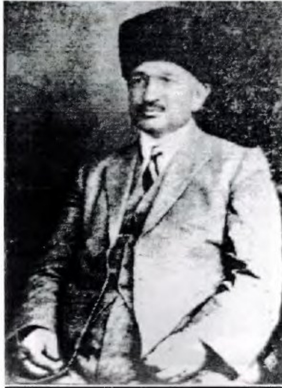
Ek-4: Kıbrıs'ta müdürlük yaptığı yıllara ait bir fotoğrafı (Öksüzoğlu 2003: 268)