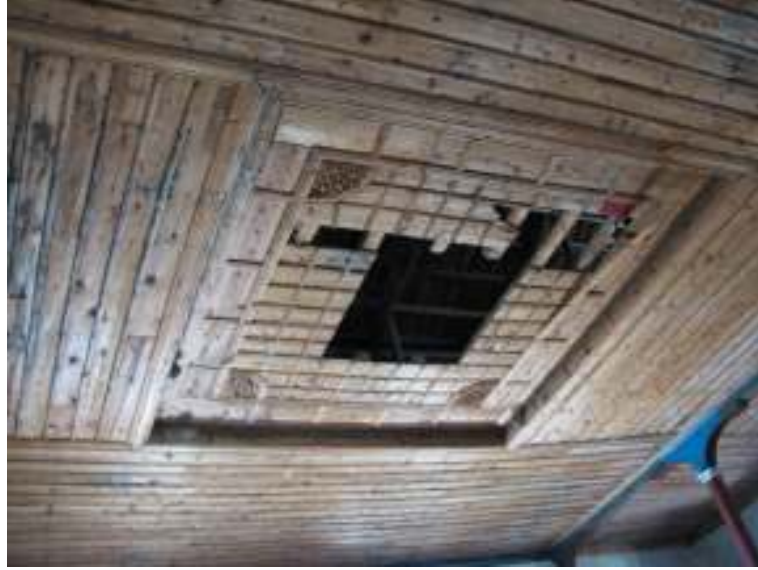
Fotograf.5- Akarca Köyü Cami. Harim. Tavan.