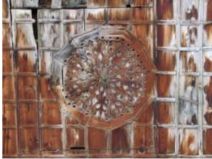
Fotograf.10- Akarca Köyü Cami. Son cemaat yeri Tavanı.