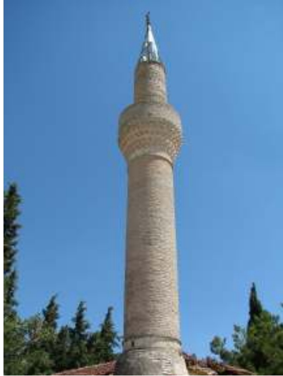
Fotograf.8- Akarca Köyü Cami. Minare Gövdesi.