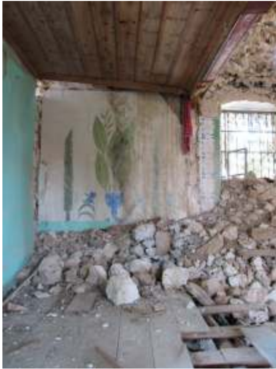
Fotograf.13- Akarca Köyü Cami. Harim. Doğu cephe duvarı kuzey kesimi.