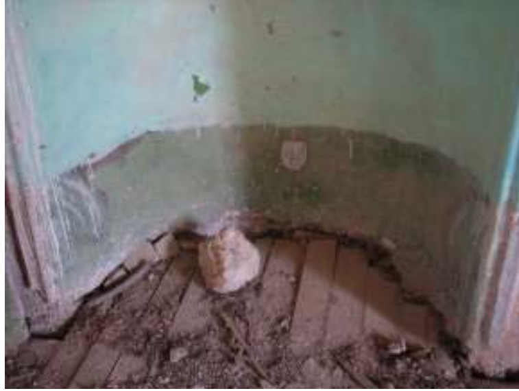
Fotograf.14- Akarca Köyü Camii. Harim. Mihrap nişi.