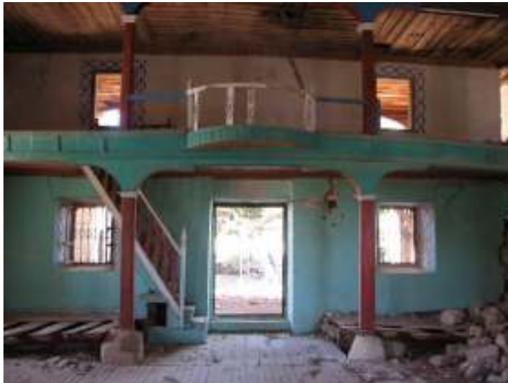
Fotograf.4- Akarca Köyü Cami. Harim. Kuzey cephe.