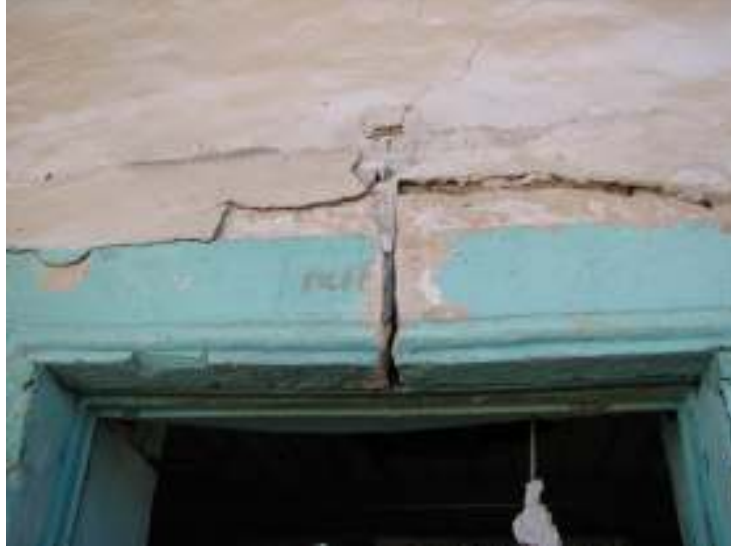
Fotograf.2- Akarca Köyü Cami. Kuzey cephe.