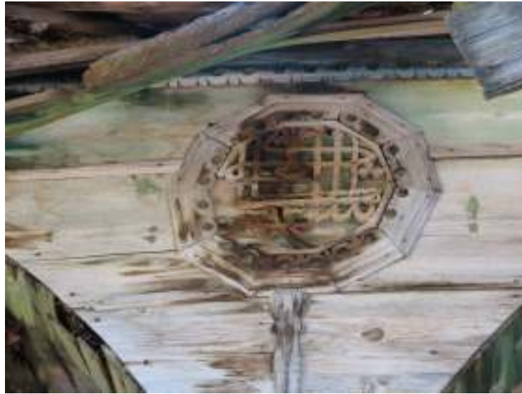
Fotograf.11- Akarca Köyü Cami. Son cemaat yeri.