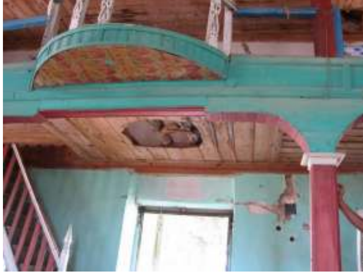
Fotograf.9- Akarca Köyü Cami. Harim. Kadınlar Mahfili Tavanı.