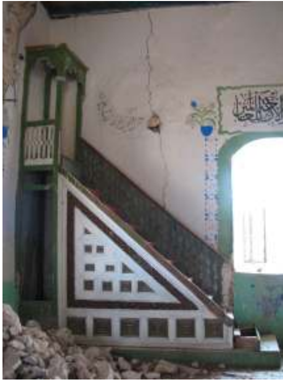
Fotograf.6- Akarca Köyü Cami. Harim. Minber.