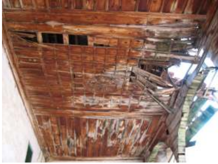
Fotograf.7- Akarca Köyü Cami. Son cemaat yeri tavanı.