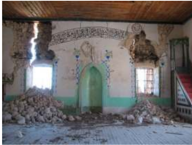
Fotograf.3- Akarca Köyü Cami. Harim. Güney cephe.