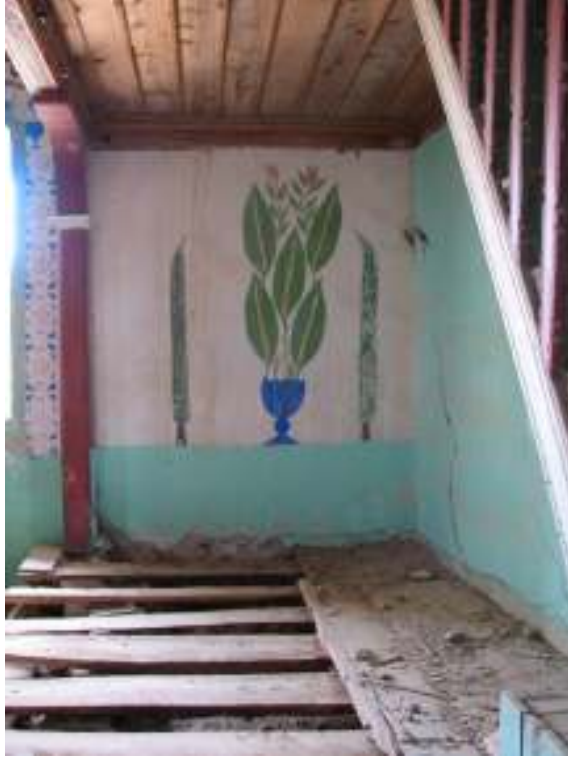
Fotograf.12- Akarca Köyü Cami. Harim. Batı cephe duvarı kuzey kesimi.