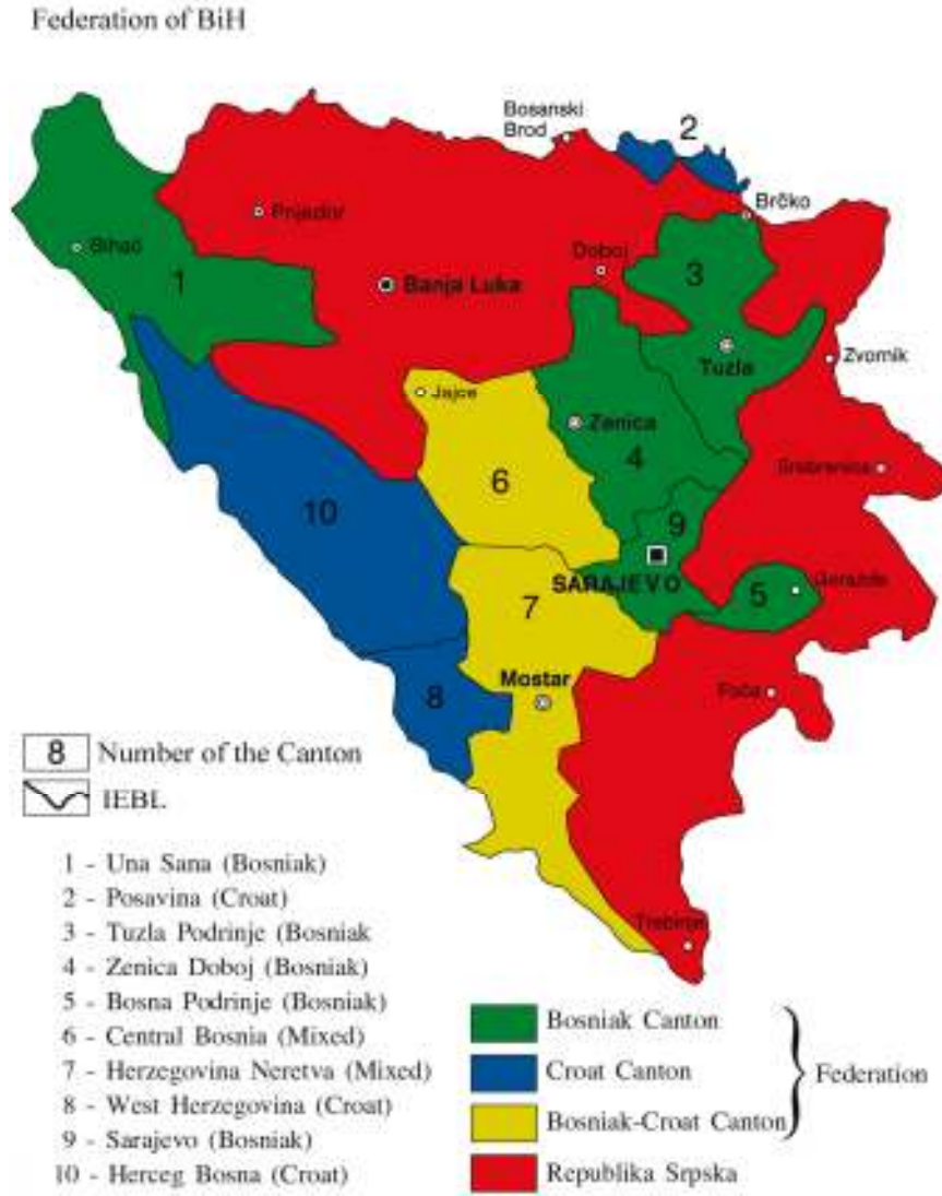
Şekil 2: Bosna Hersek'in Siyasi Haritası.