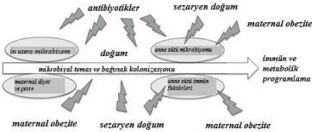
Resim 1: Erken mikrobik teması düzenleyen faktörler ve bağırsak kolonizasyonu 1

Anne sütündeki mikroorganizmaları inceleyen çalışmaları gözden geçiren LaTuga ve ark. 32 anne sütünde en yaygın olarak Stafilokok, Streptokok, Veillonella, Gemella, Enterokok, Clostridia, Bifido bakterisi, Laktobasil, Propioni bakterisi, Actinomyces, Corynebacterium, Pseudomonas, Sphingomonas, Serratia, Escherichia, Enterobacter, Ralstonia, Bradyrhizobium ve Prevotella bakterilerinin saptandığını ifade etmektedir. Yaşanılan çevre, annenin sağlık durumu, obezite, atopi, diyet, immünolojik durum, doğum şekli, gestasyonel yaş, antibiyotik kullanımı ve laktasyon aşaması anne sütü Mikrobiyotasının yapısını etkileyen en önemli etmenlerdir 6,21,30,31,32 . (Resim 1)