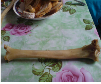
Resim 5. kar cilik ‘kamuşkemiği’ (eng. beam bone)

Kar kelimesinin kökü Moğalcaya dayanmaktadır. Moğalcada GAR kelimesi ‘kol, el’ anlamına gelmektedir (MED 1960: 350). Kar cilik ‘kamuşkemiği’ koyunun ön ayaklarında (kolunda) yer alan bir kemiktir. Dolayısıyla Kırgızlar kökü Moğalcaya dayanan kar kelimesini kullanmışlardır. Günümüze kadar kar kelimesinin karı ‘yaşlı, ihtiyar’ kelimesiyle ilişkili olduğu düşünülmüştür. Bundan dolayı bu et yaşlılara ikram edilmez. Kelime anlamıyla kar ve karı kelimeleri arasında bir bağlantı yoktur. Kazak Türkçesinde ari cilik olarak bulunmaktadır (KTT 2008: 242). Nogay Türkçesinde da karı kelimesi ‘eski zamanda ölçme şekli, kol kemiği’ anlamına gelmektedir (1963: 152). Sarı Uygurcada da kar samık ‘kamuşkemiği’ şeklinde karşımıza çıkmaktadır (1957: 53).