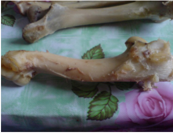
Resim 6. küñ cilik ‘diz oynacı ile kürekkemiği arasındaki kemik’

Clauson’un sözlüğünde koñ kelimesi geçmektedir. Kırgız ve Kazak Türkçelerinde koñ eti ‘kalça eti’ anlamıyla bulunmaktadır (EDP s. 632). Yudahin’in Sözlüğünde koñ kelimesi iki anlamıyla karşımıza çıkmaktadır; 1. ‘kalça eti’, 2. Tiyen-şan bölgesinde kıç kelimesiyle aynı anlama geldiği görülmektedir (1965: 403). Ancak koñ kelimesinin küñ kelimesiyle ses ve anlam bakımından aynı olması mümkün değildir. Küñ kelimesi hem Eski Türkçede (EDP s. 726) hem de Yudahin’in sözlüğünde (1965:467) ‘cariye’ anlamıyla bulunmaktadır. Yukarıda belirttiğimiz gibi küñ cilik sadece gelinlere ikram