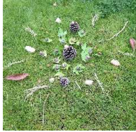
Resim 2. Ö renci çalı ması