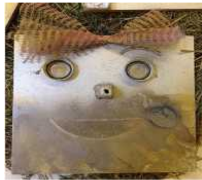
Resim 6. Ö renci çalı ması