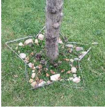
Resim 1. Ö renci çalı ması

tartı ma, sorun analizi, sanat eseri analizi, demostrasyon, i birlikli ö renme gibi ö retim teknikleri ile çe itlendirilmi tir.