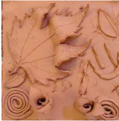
Resim 3. Ö renci çalı ması