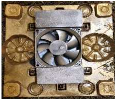
Resim 5. Ö renci çalı ması