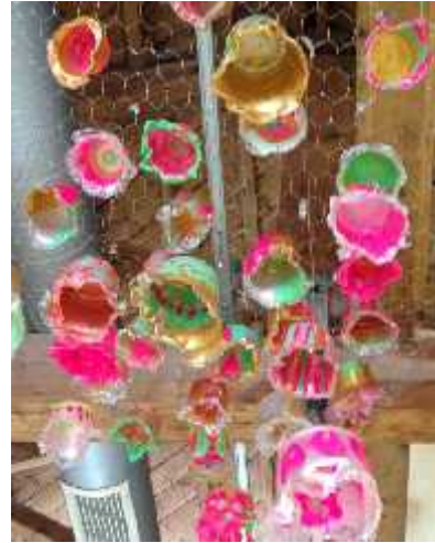
Resim 4. Ö renci çalı malarından bir düzenleme