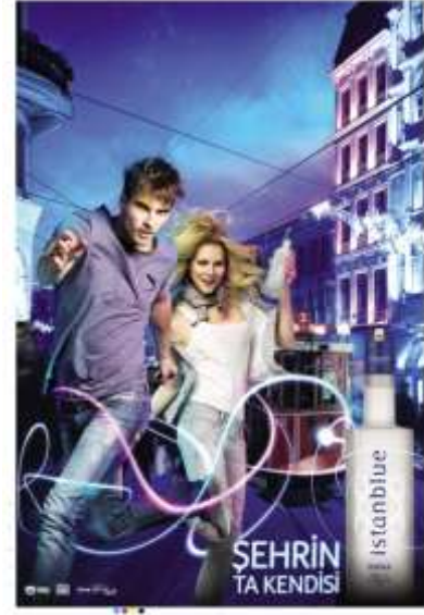
Resim 3 Votka Reklamı

Gazete reklamlarının, %30'unun yeni medya ortamlarındaki farklı mecralara yönlendirdiği saptanmıştır. Reklamlarda kullanılan yeni medya ortamları, sosyal ağlar, internet siteleri ve akıllı telefonlarda kod okuyucular aracılığıyla izlenebilen kısa filmlerdir (Tablo 3).