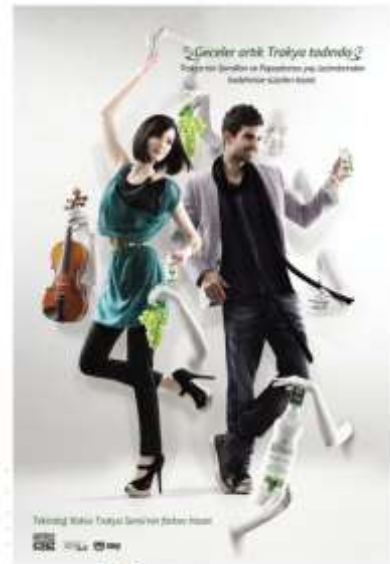
Resim 4 Rakı Reklamı