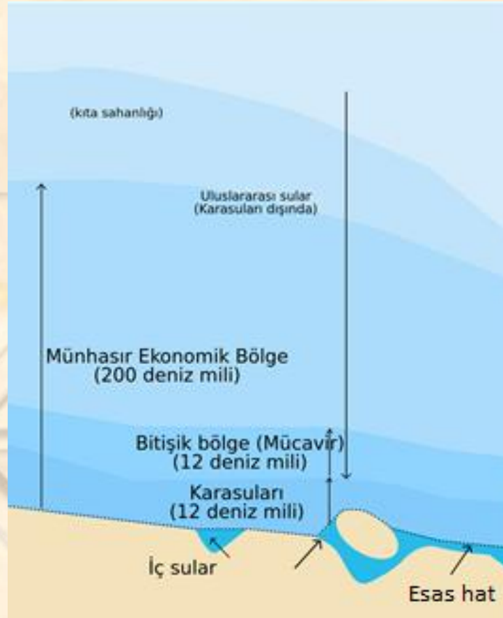
Şekil 3. Denizlerin Bölümleri.

Denizler, toplumların ulaşım, nakliye, ticaret, turizm, gıda ve savunma gibi pek çok amaçla yararlandıkları önemli alanlardır. Bu alanların kullanımı, son yüzyıla kadar uluslararası ölçekte belirlenmiş bir düzenlemeye tabi değildi. 1982 yılında üzerinde anlaşmaya varılan ve birçok ülkenin imzalayarak taraf oldukları BMDHS (Birleşmiş Milletler Uluslar arası Deniz Hukuku Sözleşmesi)'yle kurallara bağlanmıştır. Sözleşmeye taraf olmayan ülkelerde, sözleşmenin maddelerini esas alarak ve evrensel hakkaniyet kuralları çerçevesinde kendi haklarını kullanabilmektedirler. Bu hakların en başında, kıyısı olan ülkelerin denizlerde yetki alanı belirleyebilmeleri gelmektedir. Belirlenecek bu yetki alanları Şekil 3'de görüldüğü gibi karasuları, bitişik bölge, MEB ve kıta sahanlığıdır.