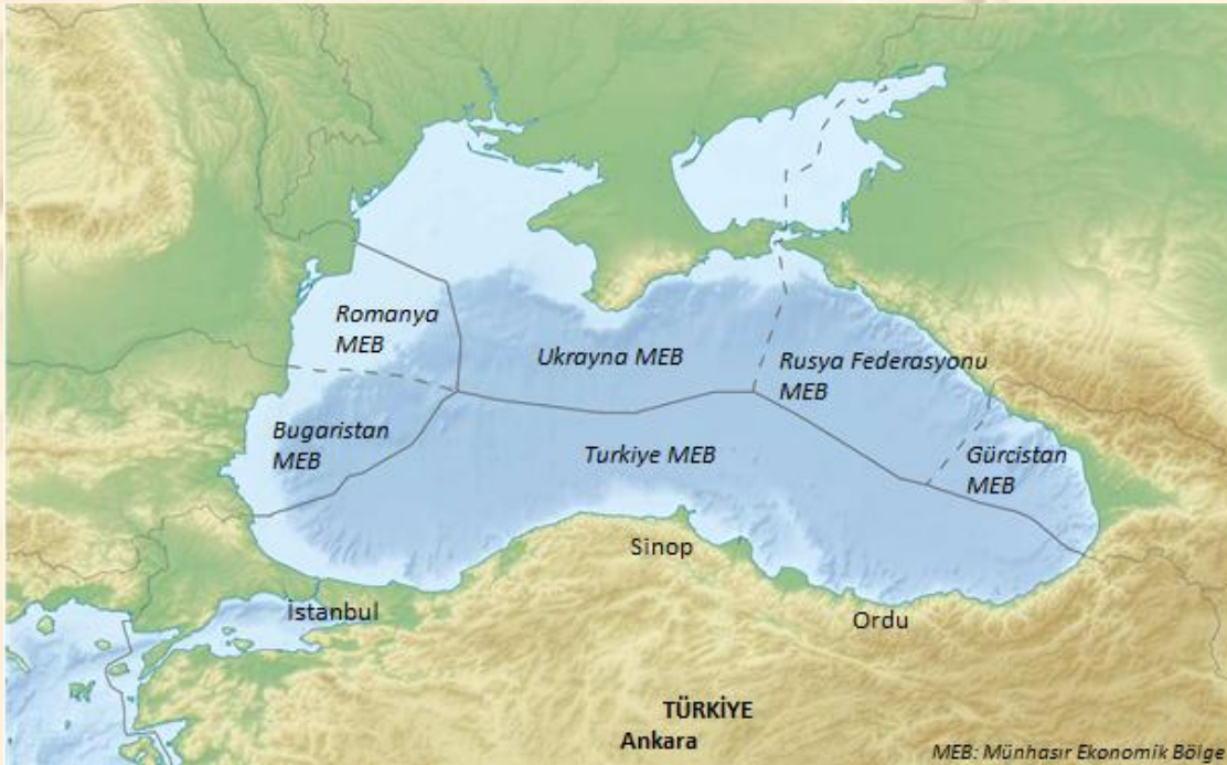
Şekil 4. Kıyısı bulunan ülkelerin Karadeniz'deki MEB'leri.