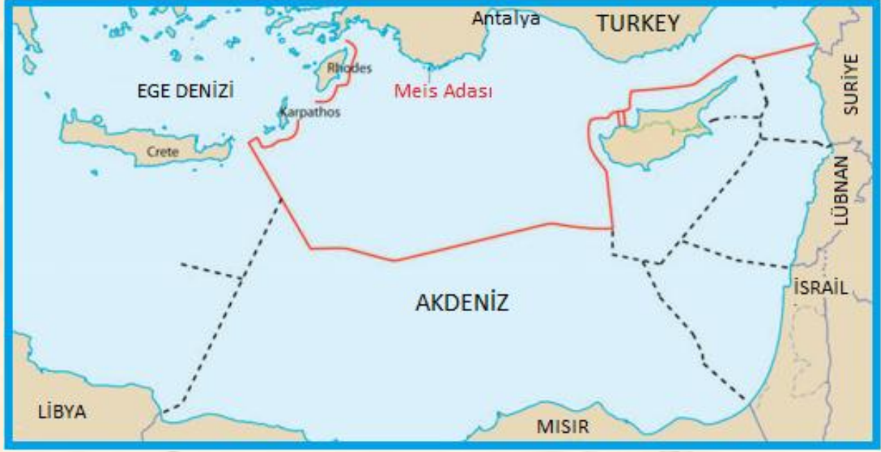
Şekil 7. Türkiye gözüyle Doğu Akdeniz'deki MEB paylaşımı

Yunanistan ve GKRY'nin Doğu Akdeniz'de gerçekleştirmeyi düşündüğü ve adeta Doğu Akdeniz'de neredeyse hiç yetki alanı bırakmayan Şekil 6'da görülen MEB paylaşımına karşılık, Türkiye tarafından Şekil 7'de görüldüğü gibi oldukça adil ve rasyonel bir MEB paylaşımının olması arzu edilmektedir.