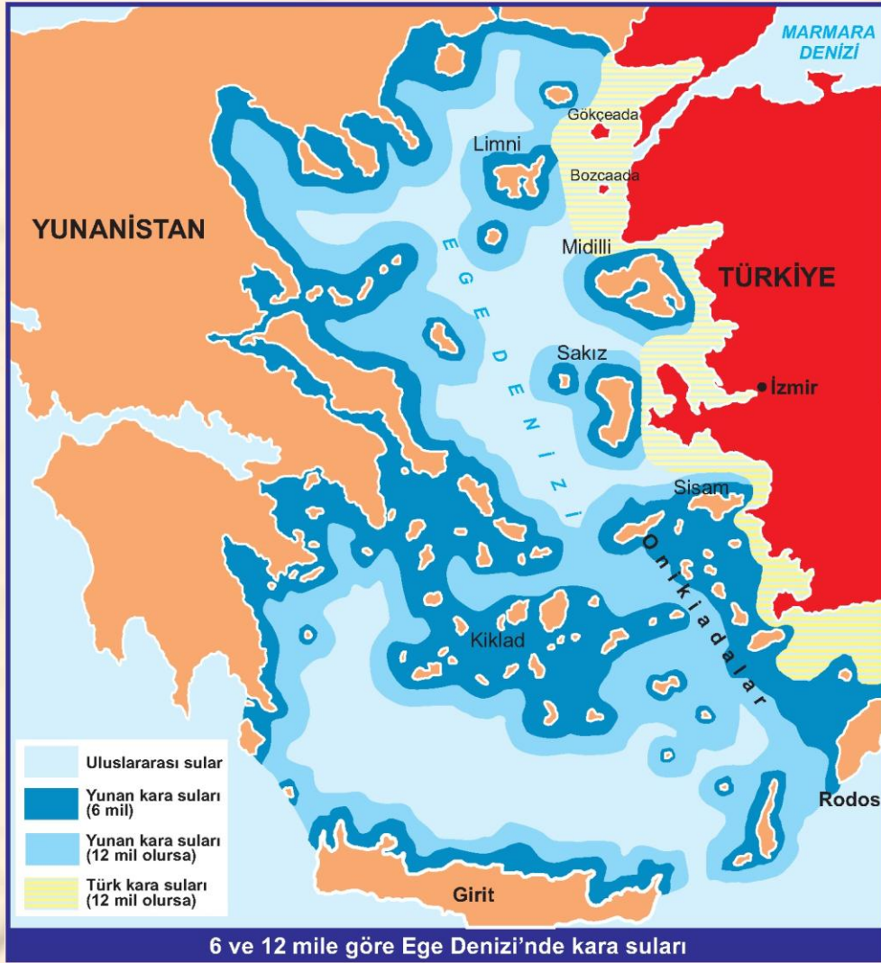
Şekil 5. Ege Denizi'ndeki 6 ve 12 mile göre karasuları.