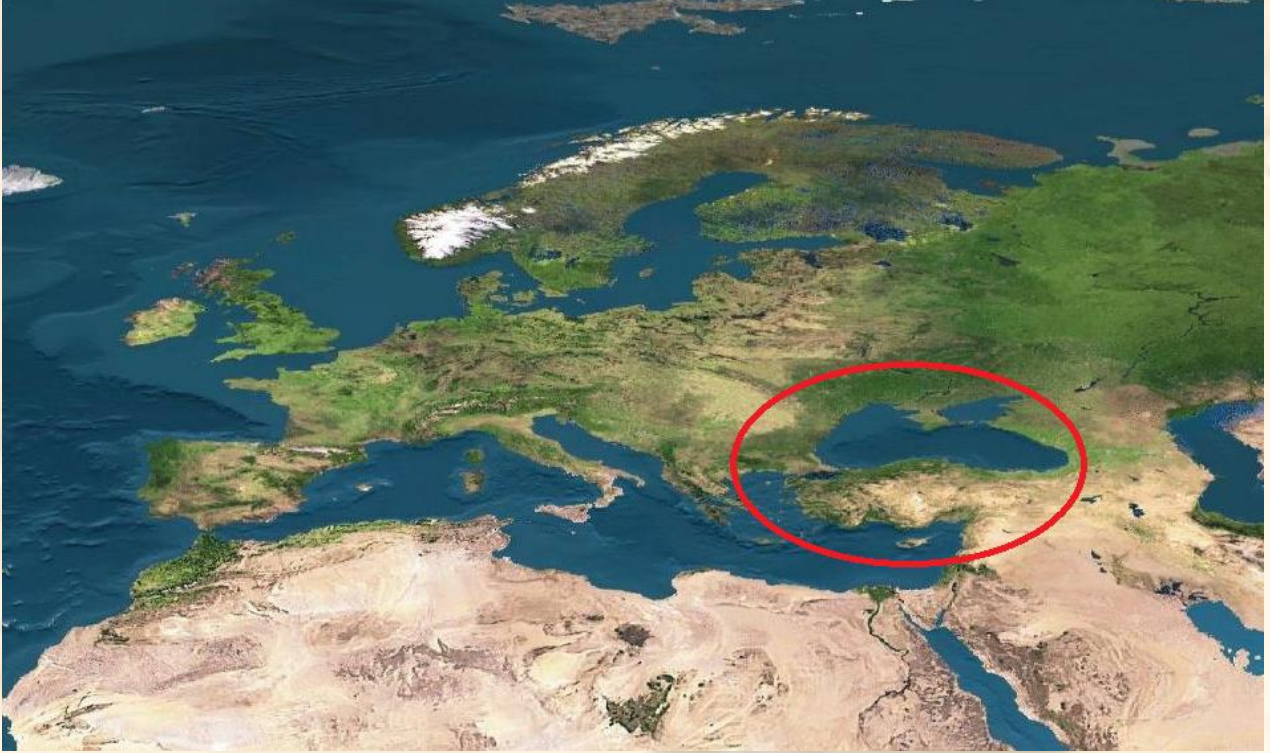
Şekil 2. Türkiye ve üç tarafını çevreleyen denizler.

Türkiye Şekil 2’de görüldüğü gibi, hem Avrupa-Asya-Afrika üçgeni arasında yer alan Akdeniz çanağının Doğusunda en fazla bu denize kıyısı olan, hem de Avrupa ve Asya kıtalarını birbirinden ayıran Ege Denizi ve Karadeniz’e kıyıları olan, bu denizleri birbirine bağlayan Çanakkale ve İstanbul boğazlarıyla Marmara Denizini içinde barındıran bir ülkedir. Hakikaten yeryüzünde bu kadar ticari, askeri, politik vb. açıdan coğrafi öneme sahip ülke çok azdır. Bu coğrafyanın önemi, tarihte de bir çok savaşın çıkmasına neden olmuştur. Günümüzde de yaşanan bazı temel sorunların altında yatan temel mesele de aslında budur. Günümüzde de Türkiye, Ege Denizi ve Doğu Akdeniz’de özellikle deniz yetki alanlarının paylaşımı konusunda kıyıdaş ülkelerle ciddi sorunlar yaşamaktadır. Bilhassa Ege Denizi, dünyanın hiçbir yerinde olmayan coğrafi bir özelliğe sahiptir. Şöyle ki, Ege’de toplam 23000 km 2 yüzölçümüne sahip 3000 civarında ada ve adacık bulunmaktadır ve bu adalar Ege Denizi’nin yaklaşık %10’nu teşkil etmektedir. Büyük adaların çoğu Türkiye’nin hemen yanı başına serpilmiştir. Ege’nin güneyi de 21 tane ada ile bir zincir gibi kapatılmış durumdadır. Bu durumu ile Ege, hukuki olarak özel bir coğrafi deniz durumundadır (Yenigün, 1996).